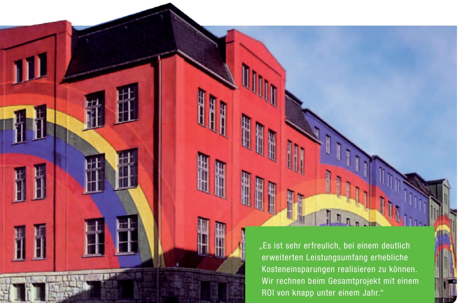
Das Rosenthal-Hauptverwaltungsgebäude in Selb wurde von dem Künstler Otto Piene zu einem Riesenbild mit 195 Meter Breite und bis zu 18 Meter Höhe verwandelt.

„Es ist sehr erfreulich, bei einem deutlich erweiterten Leistungsumfang erhebliche Kosteneinsparungen realisieren zu können. Wir rechnen beim Gesamtprojekt mit einem ROI von knapp unter einem Jahr.“